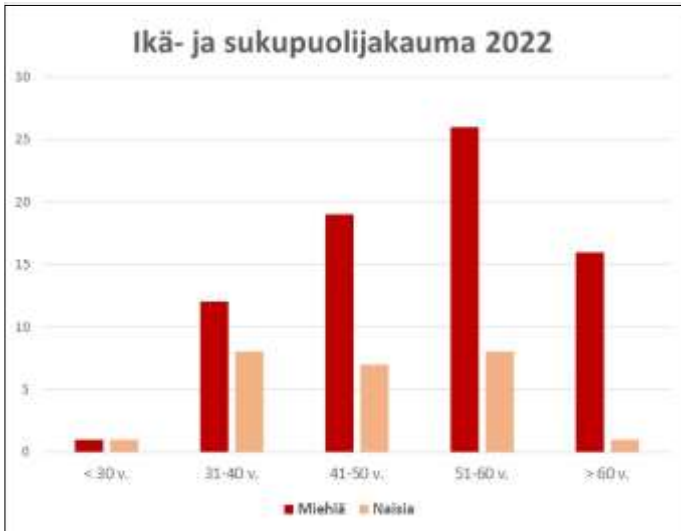
Kuva 9. Vieraskodin asukkaiden ikä- ja sukupuolijakauma.

Turvallisuuden näkökulmasta vuosi 2022 oli synkkä. Tämä oli nähtävissä kautta linjan uhka- ja vaaratilanneraportin tuloksissa, kuten myös vuoden aikana menehtyneiden asukkaiden määrässä. Kevään aikana kadulla liikkuva etsivä työ raportoi poikkeuksellisen vaarallisesta liikkeellä olevasta huumausaineesta, joka näkyi myös asumisyksikön arjessa kirjallisten varoitusten, asukkaiden menehtymisten sekä vuokrasopimuksen purkuun johtavan väkivallan lisääntymisenä poikkeukselliseen määrään. Onneksi loppuvuoteen päästäessä tilanne rauhoittui ja arki asumisyksikössä jatkui rakentavassa, turvallisessa ilmapiirissä keskittyen enemmän asumisen ja kuntoutumisen näkökulmiin.