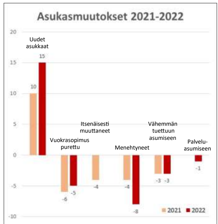
Kuva 10. Vieraskodin asukkaiden muutokset asumisessa.

Vuonna 2022 Helsingin Vieraskodin asukkaista 99 % sai asumistukea. Työttömyysturvaa sai 37 % asukkaista. Vanhuuseläkkeellä oli 12 % asukkaista ja työkyvyttömyyseläkkeellä oli 10 % asukkaista. Perustoimeentulotukea sai 56 % asukkaista. 1 % ei saanut mitään etuuksia. Vuonna 2022 Helsingin Vieraskodista asumisen tuen kautta vähemmän tuettuun asumiseen muutti kolme henkilöä (3, 2021). Vuokrasopimus purettiin viideltä asukkaalta (6, 2021). Asukkaita menehtyi kahdeksan (4, 2021). Itsenäisesti muuttaneita asukkaita ei vuonna 2022 ollut ollenkaan (4, 2021). Helsingin Vieraskodille muutti 15 uutta asukasta vuonna 2022 (10, 2021).