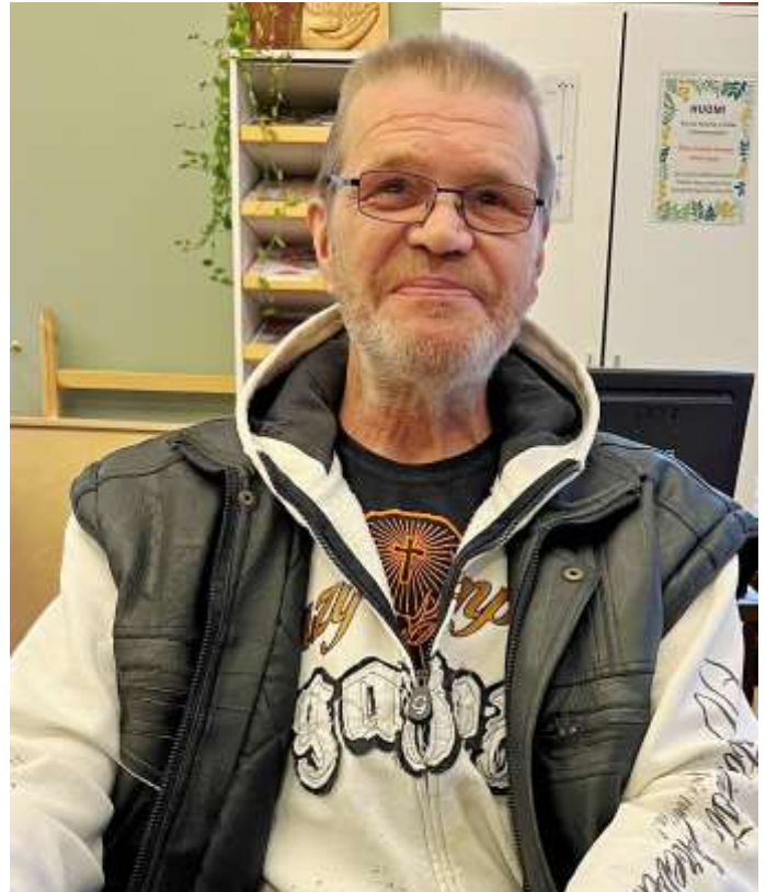
Kuva 3. Vesku.

Vuoden kääntyessä kohti loppuaan kiinteistön sammutinjärjestelmän sprinklerin hajoamisesta johtuva vesivahinko kolmannen kerroksen asunnossa aiheutti jouluaatonaaton viet-