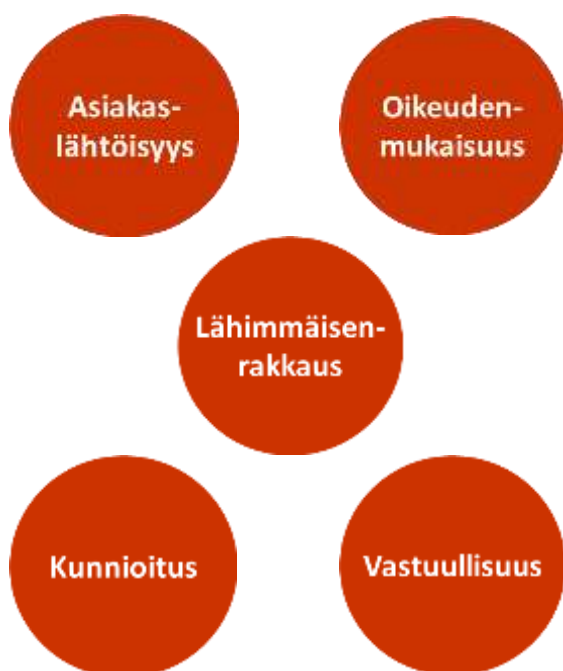
Kuva 1. Helsingin Vieraskodin toimintaa ohjaavat arvot.

Vieraskodissa on 73 peruskalustettua asuntoa, joissa on mini-keittiö, suihku ja wc. Huonekoot vaihtelevat 14,5 m 2 – 36 m 2 välillä – 11 asuntoa on suunniteltu pariskunnille. Vuosittain asukkaita Vieraskodissa on keskimäärin 82 henkilöä, asukaspaikkoja pariskuntapaikat huomioon ottaen on kokonaisuudessaan 86. Kaiken kaikkiaan vuonna 2022 Vieraskodin katon alta asunnon ja tukea sai yhteensä 101 henkilöä (2021, 98).